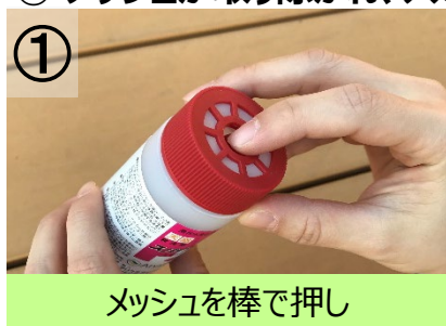
メッシュを棒で押し