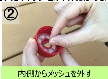
内側からメッシュを外す